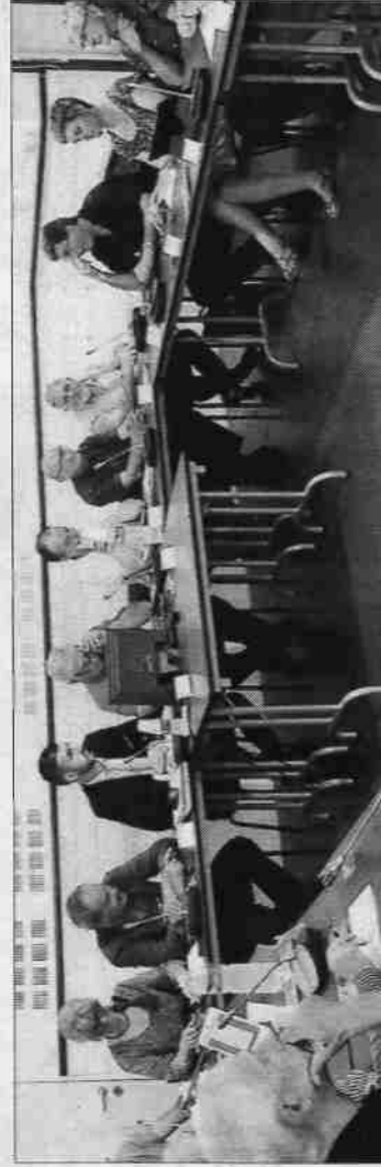
■ Une soirée compliquée pour l'exécutif de la communauté de communes.