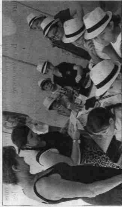
■ Enfants et personnes âgées ont partagé diverses activités.

Mardi 23 juin, la Maison Hippolyte et rurale de Saint-Hippolyte-du-Fort (MFR) a fêté la 10 ème année. Lors de cette journée intergénérationnelle par tous les apprenants de la MFR, enfants, adolescents et personnes âgées ont participé à des activités. Une journée qui a été possible grâce au soutien financier avec le département et l'ARS. Des ateliers différents acteurs ont participé tels que l'école primaire et la maternelle