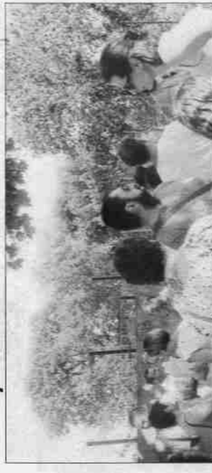
■ Les élèves ont partagé leur expérience avec les parents.