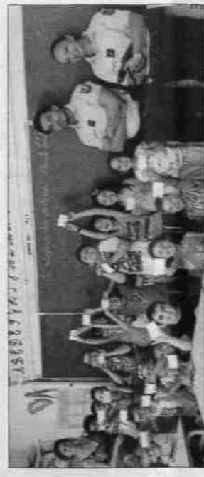
■ Les écoliers, très fiers d'avoir reçu leur permis piéton.